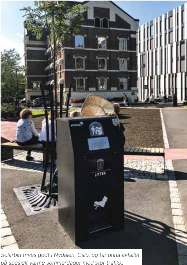
Solarbin trives godt i Nydalen, Oslo, og tar unna avfallet på spesielt varme sommerdager med stor trafikk.