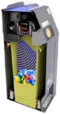
Den integrerte sensoren sender real-time fyllingsgradsdata til "BriteBin" systemet.

Den unike nivåmåleren gir presis avlesning, og systemet registrerer fyllingsgrad, utarbeider tømmerutiner, statistikk på avfallsmengder og gir varsling via e-post eller sms.