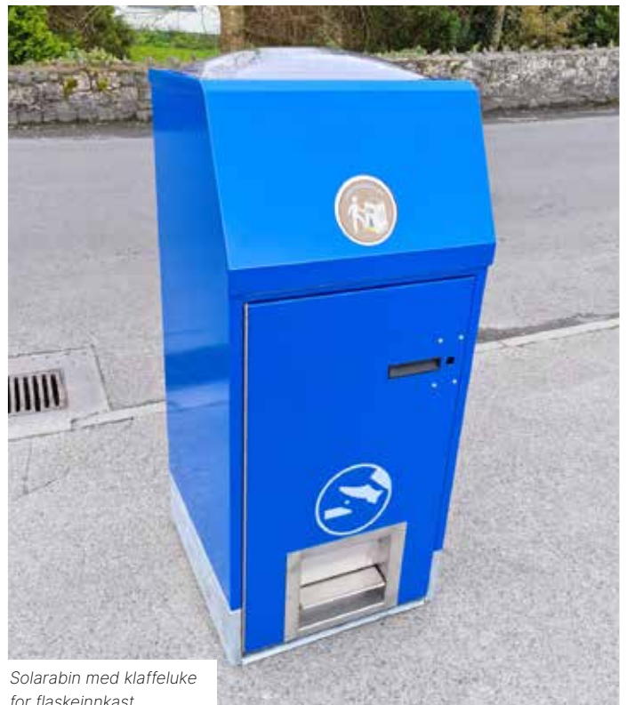
Solarabin med klaffeluke for flaskeinnkast.