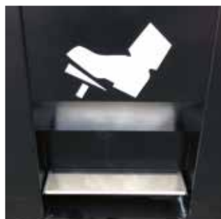
Integrert fotpedal for bedre hygiene er standard. Plassert hensiktsmessig ifht. snømåking og renhold.