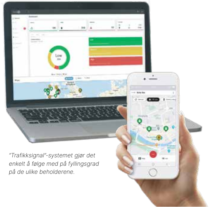
"Trafikksignal"-systemet gjør det enkelt å følge med på fyllingsgrad på de ulike beholderene.