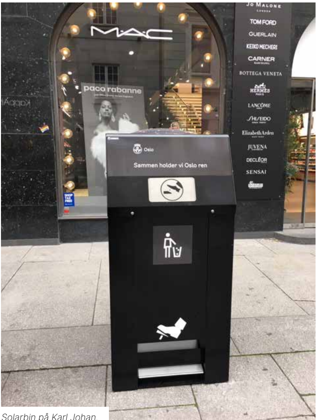
Solarbin på Karl Johan.