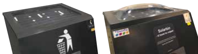
Solcelletopp i polykarbonat. Flat eller buet topp.

Solcelletoppen er i polykarbonat, "uknuselig plast". UV-beskyttet, flat eller buet topp. Integreert fotpedal sikrer bedre hygiene da beholderen er berøringsfri.