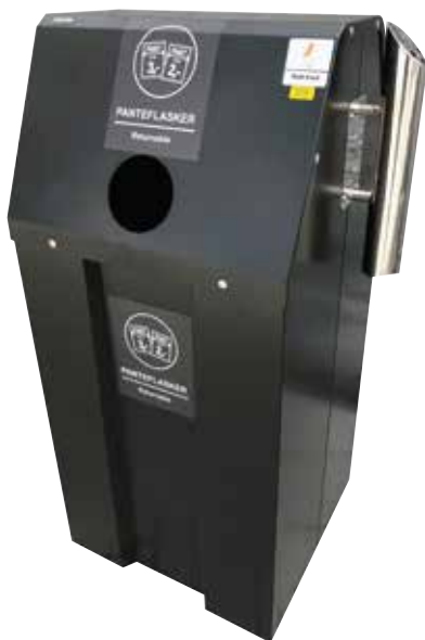
Tilhørende avfallsbeholder uten solcelle/komprimering. Askebeger kan bestilles som tillegg til alle modeller.

Fåes i 120, 240 eller 360 liter. Med front eller sideåpning. "BriteBin" holder kontroll på fyllingsgrad.