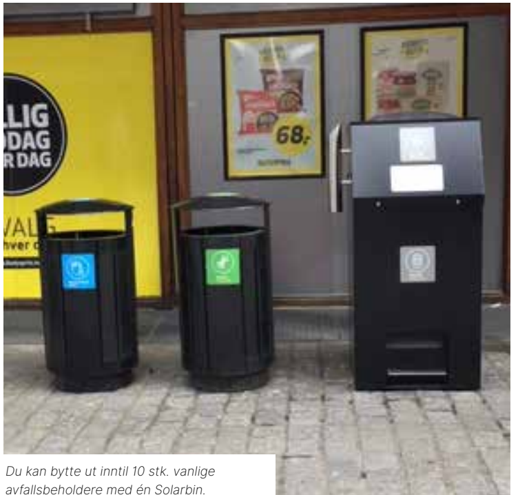
Du kan bytte ut inntil 10 stk. vanlige avfallsbeholdere med én Solarbin.