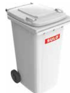
Avfallet komprimeres direkte i standard 2-hjuls beholdere på 120/ 240 liter. Enkel og funksjonell tømming!