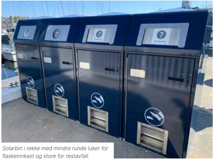
Solarbin i rekke med mindre runde luker for flaskeinnkast og store for restavfall.