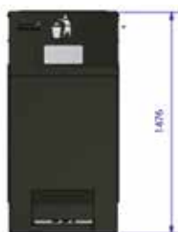
240 L BIN