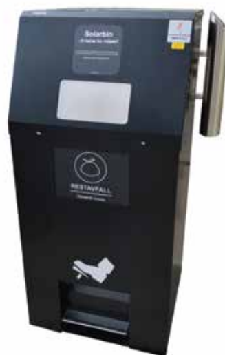
Solarbin med klaffeluke som leveres i ønsket form/størrelse.

For at man skal ha flere valgmuligheter rundt plassering av beholderne, kan man få service-/tømmedør foran, bak eller på siden. Det gjør at de kan stå inntil bygninger, foran fortauskanter eller andre steder med spesifikke krav til tømming.