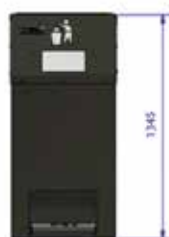
120 L BIN