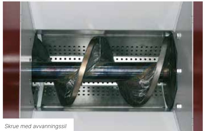
Skrue med avvanningssil