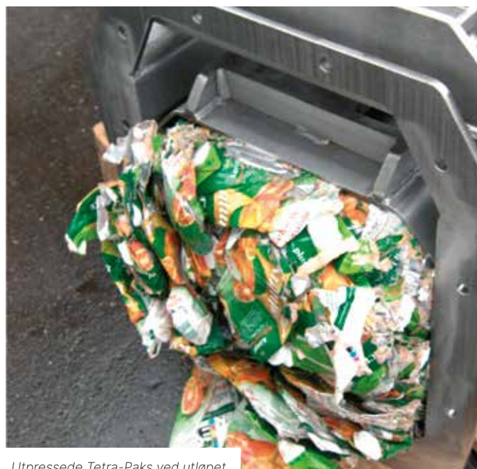
Utpressede Tetra-Paks ved utløpet