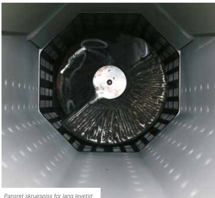
Pansret skruespiss for lang levetid