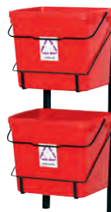
SS8086-01 + SS8086-01