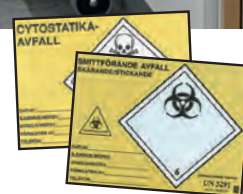
Etiketter kan leveres som tilbehør.