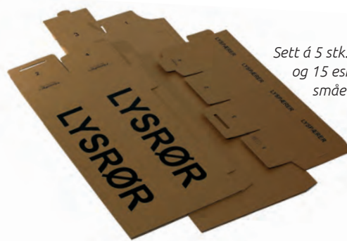
Sett á 5 stk. esker for lysrør og 15 esker for batterier, småelektrisk og lyskilder.