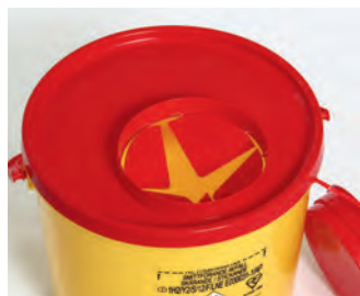
PBS-serien med vendbart lokk