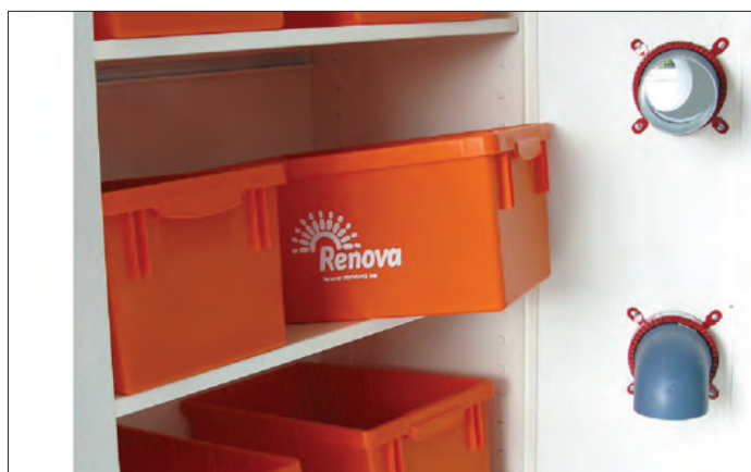
Fraksjonene samles i separate bokser inne i skapet.

EnviroPac introduserer innsamlingsnett som deles ut til forbruker. Forbruker samler og sorterer. Når nettet er fullt fraktes produktene til «Samleren».