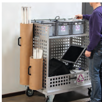
Komplett vogn med 3 bokser