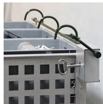
Låssylinder i ALU sink