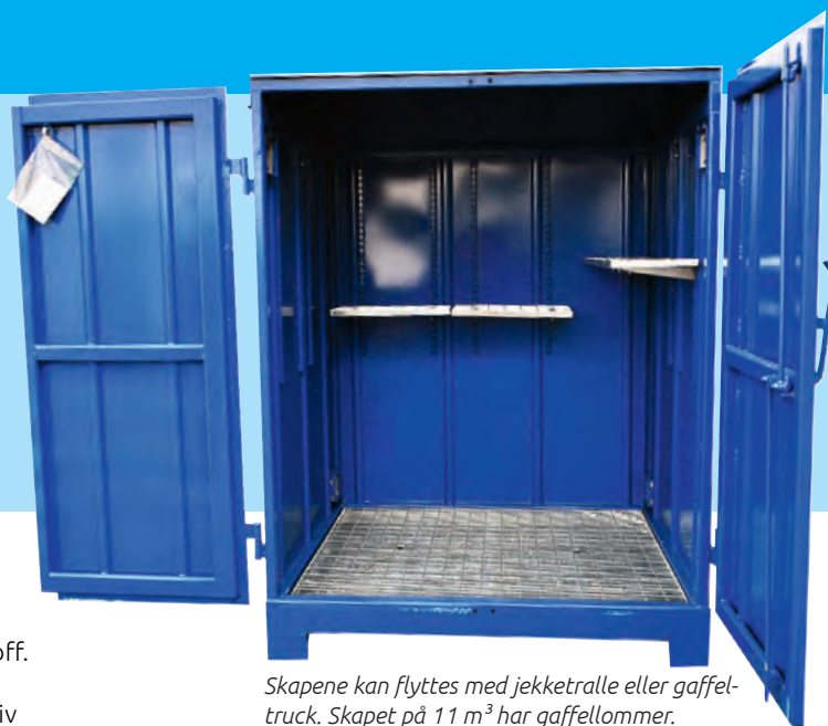
Skapene kan flyttes med jekketralle eller gaffeltruck. Skapet på 11 m 3 har gaffellommer.

Et miljøskap vil hjelpe til med å ta kontroll på de farlige stoffene i bedriften. Farlige stoffer kan være så mangt. Fra maling, spraybokser og rengjøringsmidler til oljefilter, spillolje og drivstoff. Å sette de farlige stoffene i sytem sørger for at regelverket imøtegår. Det gir både bedre og sikrere arbeidsmiljø, og en positiv miljøprofil for bedriften.