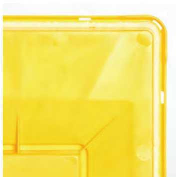
Lateksfritt forseglingslim garanterer tett beholder.