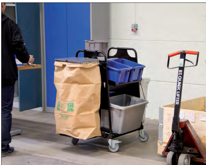
Trallen er uunnværlig for lageret og kan tilpasses med ønskede fraksjoner.