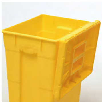
Enkeltlokket kan oppbevares/ henges på boksens langside ved hjelp av hakene.