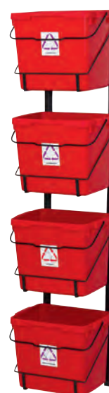
SS8086-03 + 8086-01