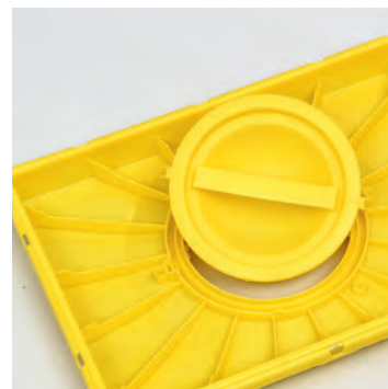
Dobbeltlokk med forseglingslim også i det runde lokket. Det runde lokket kan lukkes temporært eller permanent.