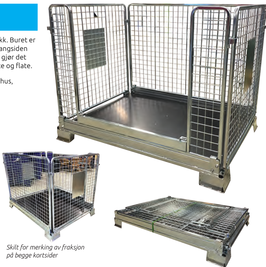
Skilt for merking av fraksjon på begge kortsider