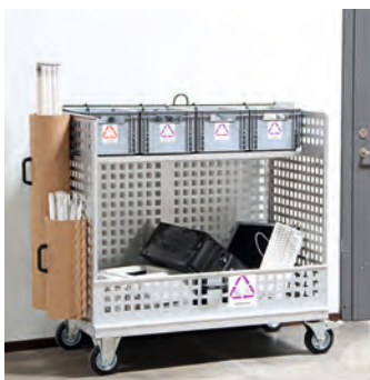
Komplett vogn med 4 stk. bokser