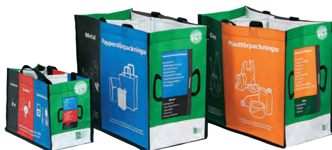
Innsamlingsnett i resikulert PET.