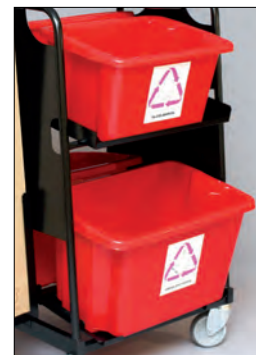
SS8533-05 / SS8555-05