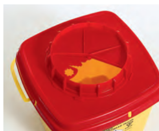
CS-serien med vrilokk

PBS-serien har vendbart lokk for midlertidig eller permanent forsegling.