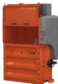
Emballasjepresse Orwak Power 3420