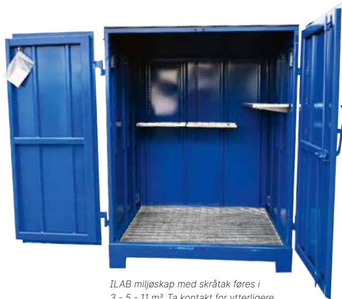
ILAB miljøskap med skråtak føres i 3 - 5 - 11 m 3 . Ta kontakt for ytterligere informasjon!