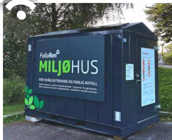
Follo Ren har belysning i miljøhuset som drives av et solcellepanel på taket. I tillegg sikker adgangskontroll m/app..