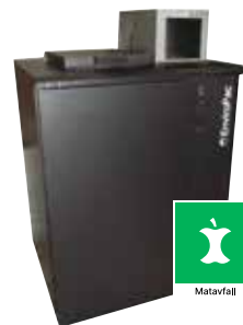
Avfallskjøler for matavfall

Miljø-/avfallsrommet er et samarbeidsprosjekt mellom Euroteknikk AS og EnviroPac AS.