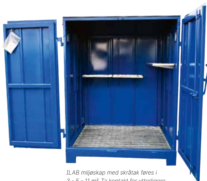
ILAB miljøskap med skråtak føres i 3 - 5 - 11 m 3 . Ta kontakt for ytterligere informasjon!