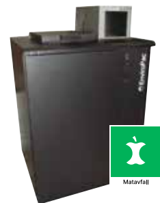
Avfallskjøler for matavfall

Miljø-/avfallsrommet er et samarbeidsprosjekt mellom Euroteknikk AS og EnviroPac AS.