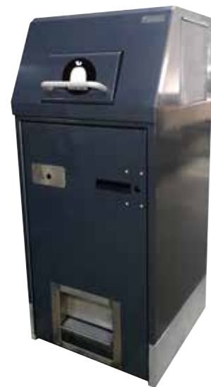
Solarbin med utovervendt skuffe og integrert askebeger.