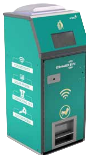
Solarbin med klaffeluke som åpnes automatisk.