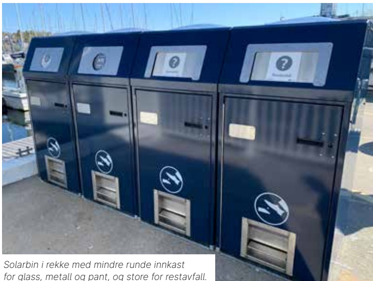
Solarbin i rekke med mindre runde innkast for glass, metall og pant, og store for restavfall.