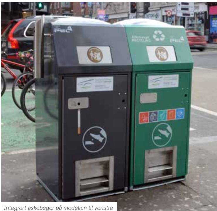
Integrert askebegeter på modellen til venstre