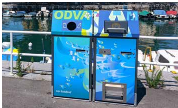
Avfallsbeholder uten komprimering til venstre.