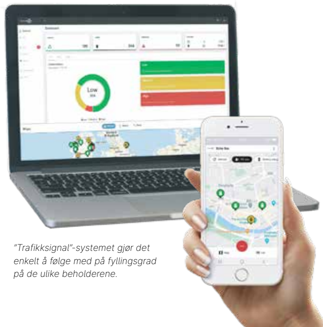
"Trafikksignal"-systemet gjør det enkelt å følge med på fyllingsgrad på de ulike beholderene.