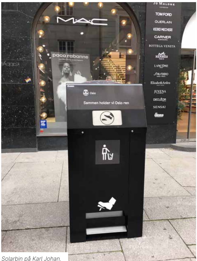
Solarbin på Karl Johan.