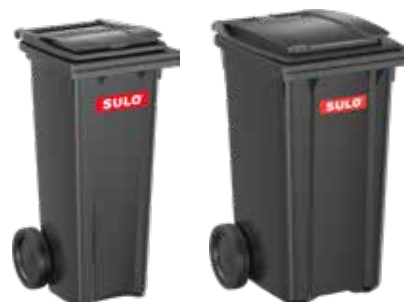
Avfallet komprimeres direkte i standard 2-hjuls beholdere på 120/ 240 liter. Enkel og funksjonell tømming!