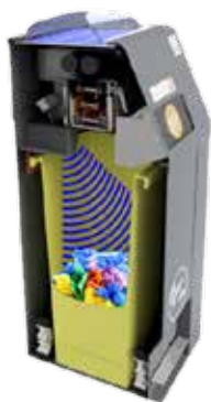
Den integrerte sensoren sender real-time fyllingsgradsdata til "BriteBin" systemet.

Den unike nivåmåleren gir presis avlesning, og systemet registrerer fyllingsgrad, utarbeider tømmerutiner, statistikk på avfallsmengder og gir varsling via push, e-post eller sms.