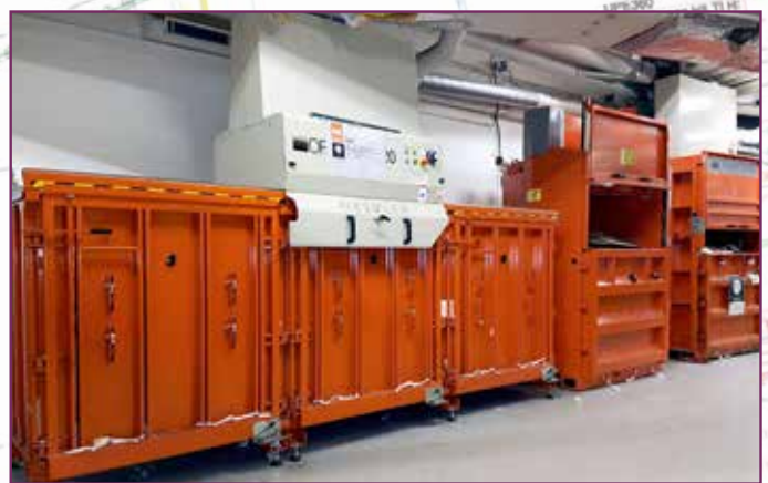
Avfallsrommet på Trondheim Torg er ryddig og vel organisert med tydelig merking for alle brukerne.