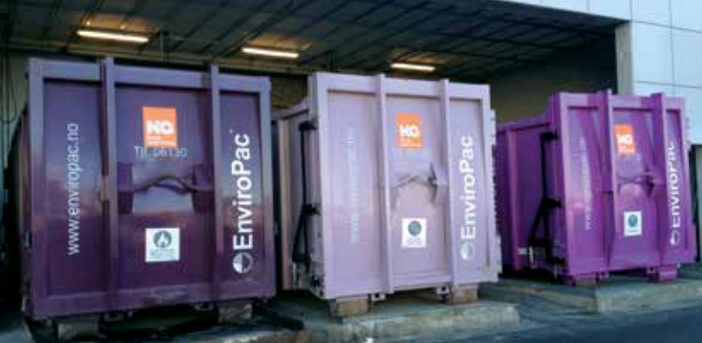
Vi kildesorterer: Amfi Kvadrat i Sandnes valgte friske farger på komprimatorene som et element for å få oppmerksomhet blant de ansatte på kildesorteringen.