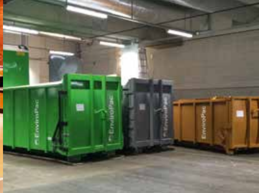
Som en rød tråd gjennom hele ditt prosjekt: Fargene går som en rød tråd gjennom hele bygget. Fra kildesorteringen i felles kundearealer til komprimatorene i avfallsrommet.